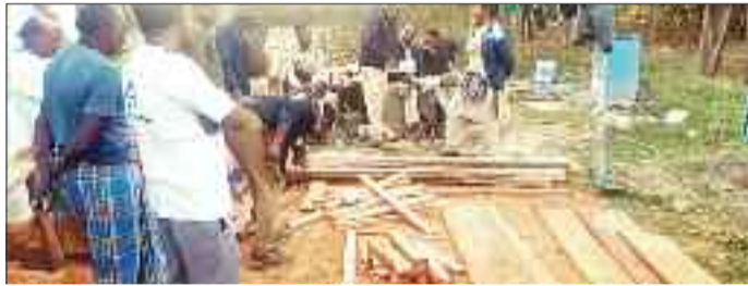
कार्रवाई करत वन विभाग का अमला।

कुछ ग्रामीणों द्वारा बीजा सहित अन्य इमारती लकड़ियों की अवैध कटाई कर उसे चोरी चुपके से घर में बढ़ाई बुलाकर दरवाजा, खिड़की व पल्ला तैयार किया जा रहा था। जैसे ही वन विभाग के अफसर को इसकी भनक लगी वन विभाग की एक टीम ने मौके पर छापा मारा की कार्रवाई की। जहां वन अमले को मौके से 7 नग बीजा का दरवाजा, 5 नग पल्ला, 26 नग खिड़की का प्रेम जप्त किया गया है। मामले में वन विभाग की टीम ने वन अधिनियम के तहत मामला दर्ज किया है।