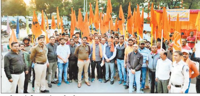
प्रदर्शन करते बीएमएस के कार्यकर्ता।

हरिभूमि न्यूज ►► कोरबा वर्तमान में कोयला खान भविष्य निधि (सीएमपीएफ) में हुए लगभग 900 करोड़ रुपए घोटाले की सीबीआई से जांच की मांग तथा कोयला क्षेत्र में कार्यरत ठेका मजदूर के अधिकारों का हो रहे शोषण के