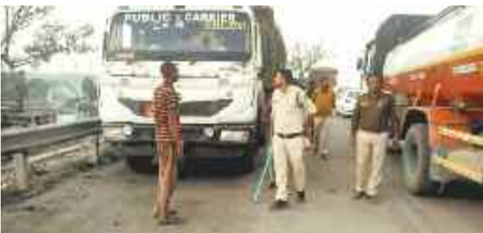
वाहन चालकों पर कार्यवाही करती पुलिस।