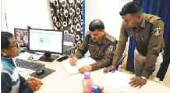
बैंक की चेकिंग करते पुलिस कर्मी।