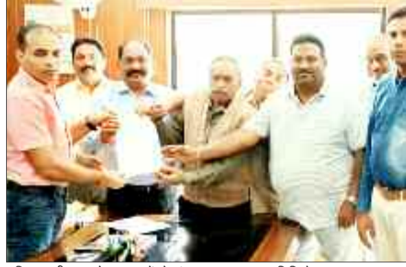
पुलिस अधीक्षक को ज्ञापन सौंपते संयुक्त सलाहकार समिति के सदस्य।