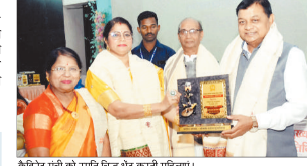
कैबिनेट मंत्री को स्मृति चिन्ह भेंट करती महिलाएं।