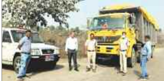
राखड़ परिवहन में लगे वाहनों पर कार्यवाही करती अधिकारियों की टीम।

सघन जांच की। इस दौरान बिना तिरपाल, बिना रिफ्लेक्टर और बिना फिटनेस के संचालित राखड़